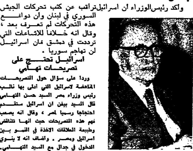
وأكد رئيس الوزراء ان إسرائيل تراقب عن كثب تحركات الجيش السوري في لبنان وأن دوافع هذه التحركات لم تعرف بعد ، وقال انه خلافا للاشاعات التي تردت في دمشق فان إسرائيل لن تهاجم سوريا .

القدس - صرح السيد مناخيم بيغن رئيس الوزراء بأنه اذا تعرض المسيحيون في لبنان الى اي اعتداء فان اسرائيل لن تقف مكتوفة الايدي وقال ان تعهدات إسرائيل في لبنان قائمة ولقد منعنا ابادتهم في الماضي وسوف نهب لمساعدتهم في المستقبل اذا ما واجهتهم الاخطار . وقال رئيس الوزراء الذي كان يتحدث في المائدة التقليدية التي اقامتها على شرفه رابطة المراسلين الصحفيين الاجانب في البلادانه لا يقصد فقط المسيحيين في جنوب لبنان بل ايضا الاقلية المسيحية في شمال لبنان .